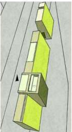
Beeld van de gewenste uitbreiding aan weerskanten van het bestaande gebouw in het midden.

Behalve de West-Frisia (223 leden) behoren ook de West-Frisia (17 leden), schaatservereniging IJsermarkt (100 leden), skeelerenvereniging Stede Sloec (100 leden), jou de bouwerclub De Droomlandarts (21 leden), en het gemengde hoort Friesland (44 leden) het clubgebouw. Dit zijn de vaste gebruikers. Het gebouw wordt ook nog gebruikt door de Zandvloem en voor de Ronde van de Bakkerstraat en Hattendorp Bovenkantje.