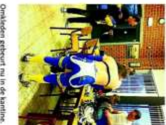
Omkleeden gebeurt nu in de kantine.

Groot handpunt is het rechte aanpak. Om die reden maken de clubvereniging en de schaatservereniging zelfs gebruik van zeeconcreet verdere in het park. De machines voor de ijstherapie staan hier, maar die starten door de loodse op-